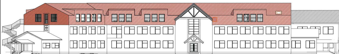
PÜÜSI KOOLI KATUSEKORRUSE VÄLJAEHITAMISE ESKIIS OÜ b210, arhitektid Karin Tõugu, Katrin Koov, Nele Švems